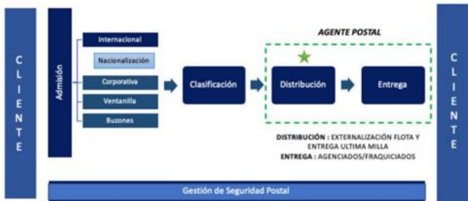
Gráfico 1. Modelo operativo